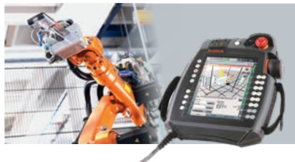
Mobile HMI für Industrieroboter