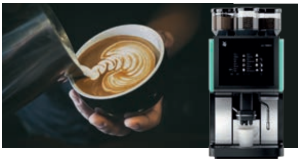
HMI und Steuerung für Kaffeeautomat