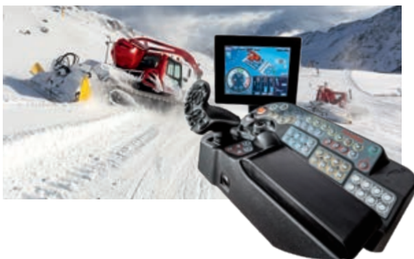
iTerminal für Pistenbully